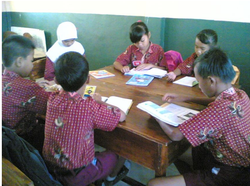
Siswa bersama kelompoknya mengerjakan masalah yang diberikan guru 1