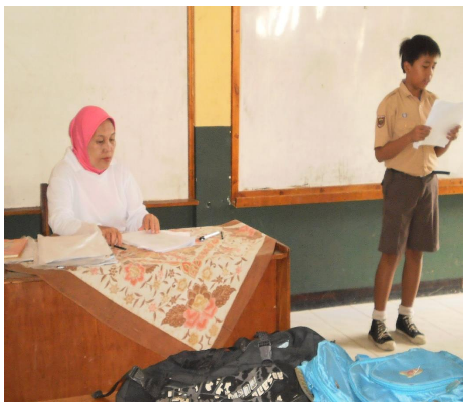
Perwakilan kelompok membacakan hasil diskusi kelompok di depan kelas