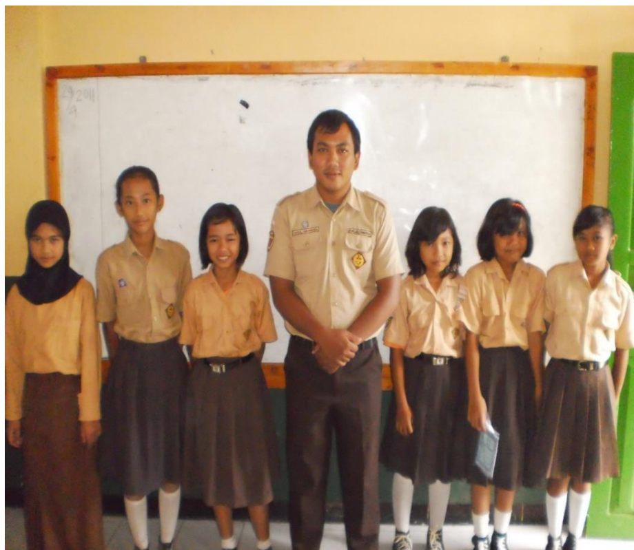
Observer berfoto dengan para siswa