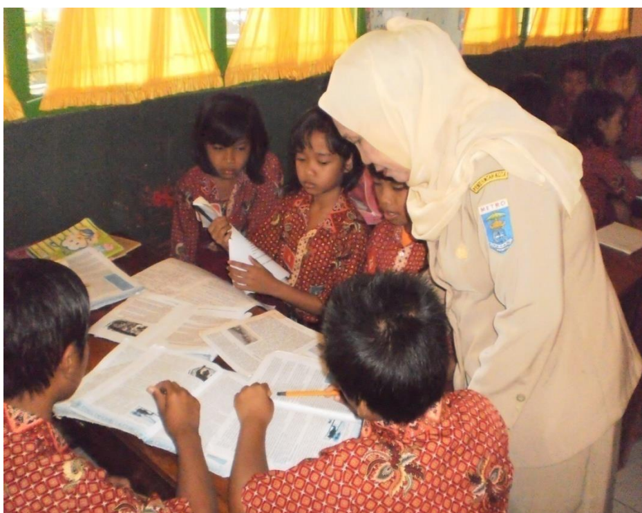
Guru membimbing siswa dalam melakukan diskusi untuk memecahkan masalah yang diberikan guru 2