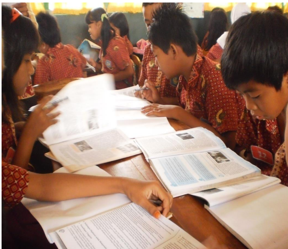
Siswa antusias mencari jawaban dalam mengerjakan soal yang diberikan guru