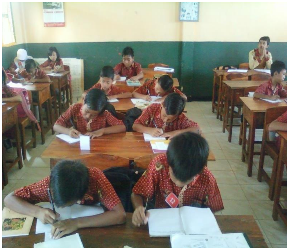
Siswa antusias mengerjakan soal yang diberikan guru