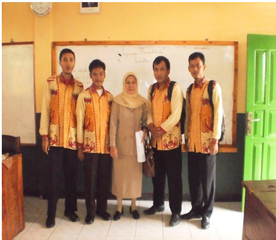
Observer berfoto bersama dengan guru yang menjadi teman sejawat