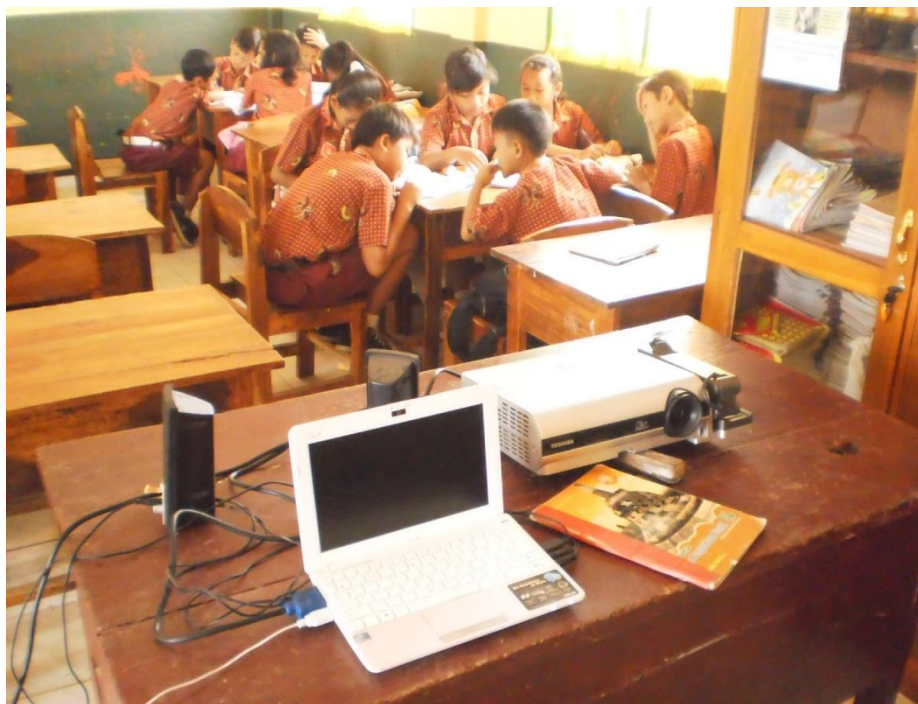
Media yang digunakan dalam pemutaran video pembacaan teks proklamasi