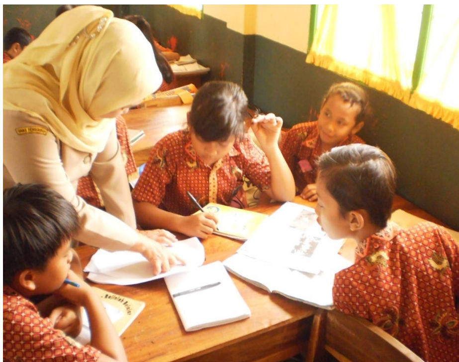
Guru membimbing siswa dalam melakukan diskusi untuk memecahkan masalah yang diberikan guru 4