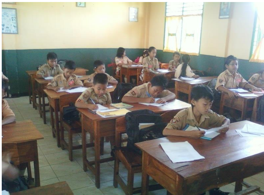
Para siswa mengerjakan soal yang diberikan guru