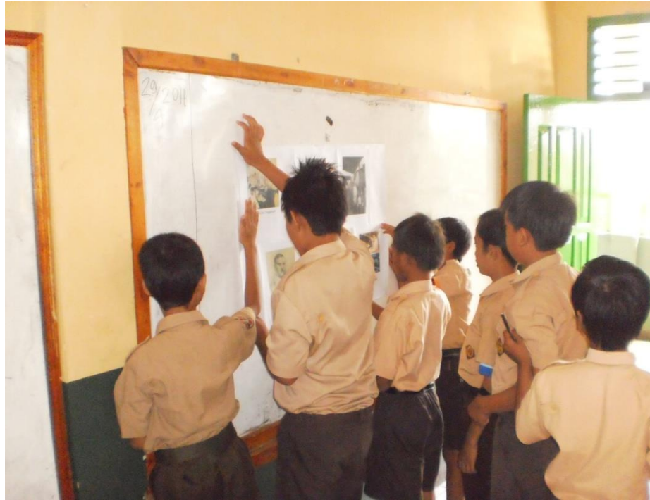
Siswa antusias membantu guru dalam memasang media berupa chart (gambar)