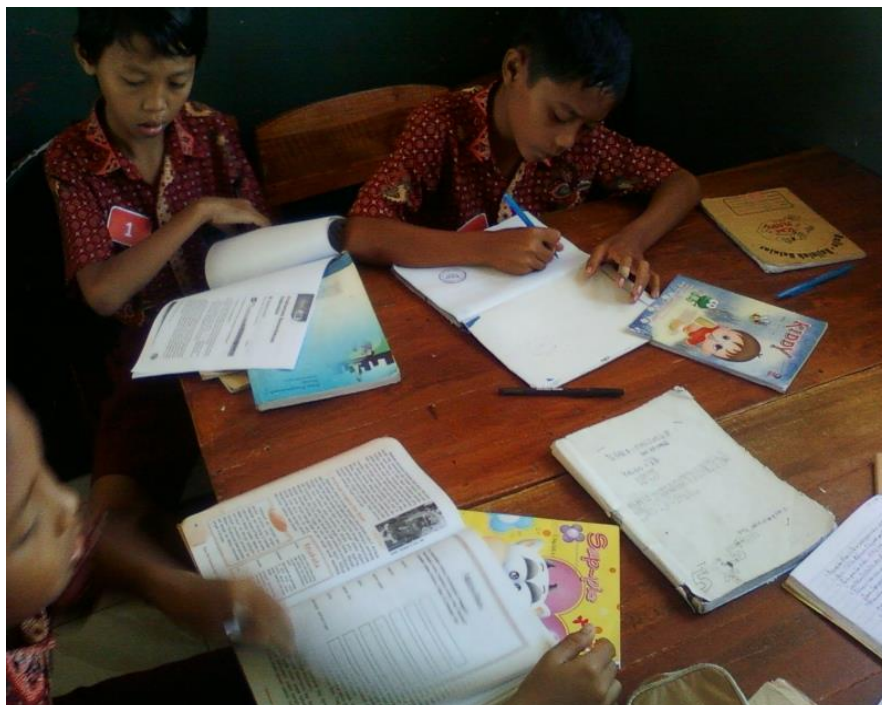
Siswa bersama kelompoknya mengerjakan masalah yang diberikan guru 2