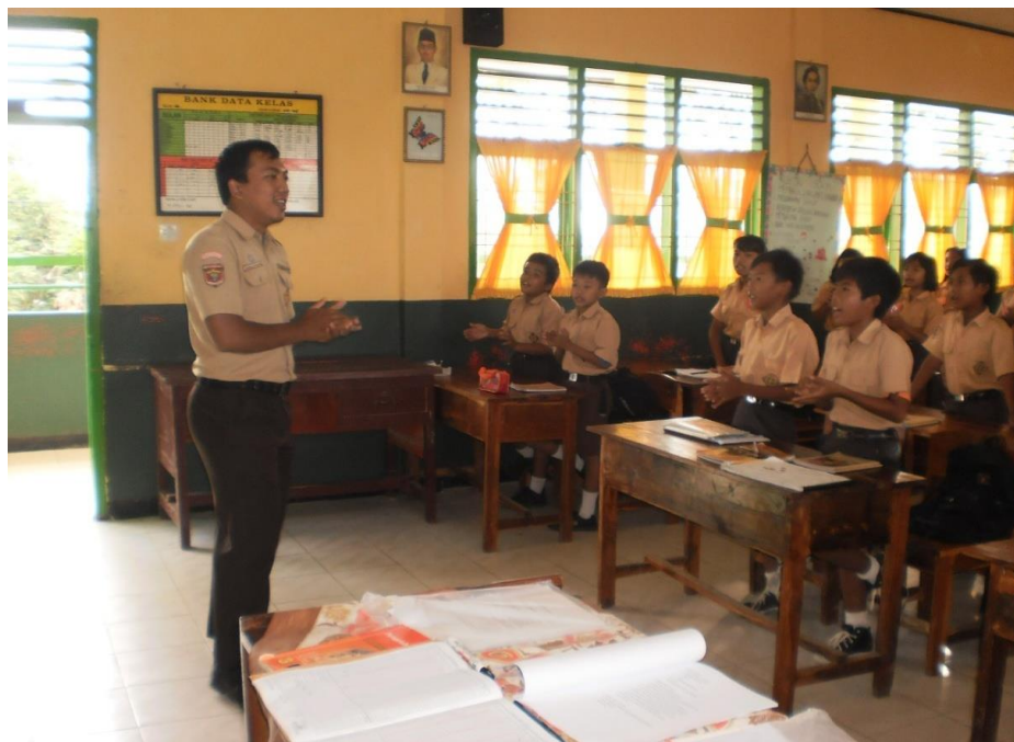
Observer mengajak siswa menyanyikan lagu “hallo-hallo Bandung”