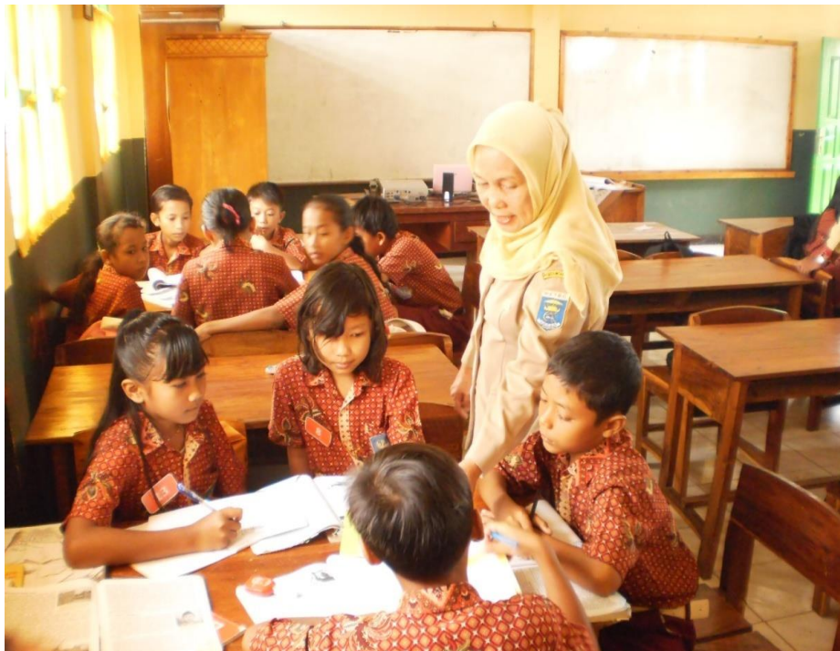
Guru membimbing siswa dalam melakukan diskusi untuk memecahkan masalah yang diberikan guru 3