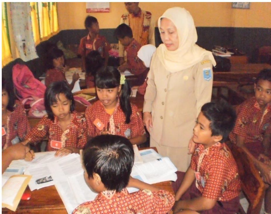
Guru membimbing siswa dalam melakukan diskusi untuk memecahkan masalah yang diberikan guru 1