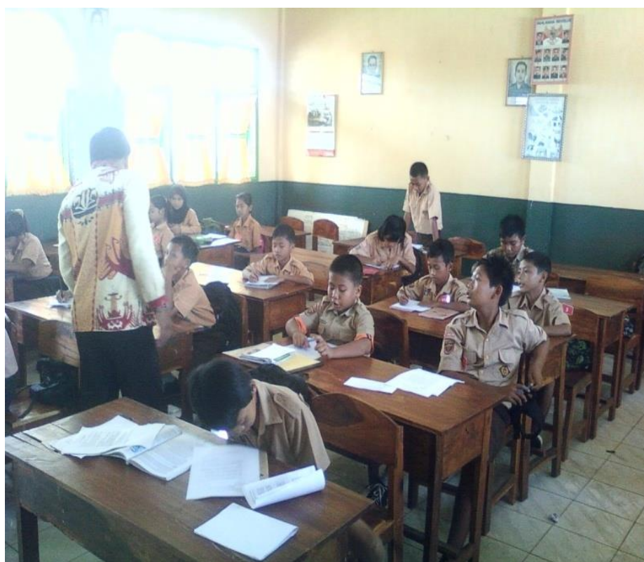
Observer membantu guru mengarahkan siswa dalam pelaksanaan pembelajaran dengan menggunakan metode Problem Based Learning (PBL)