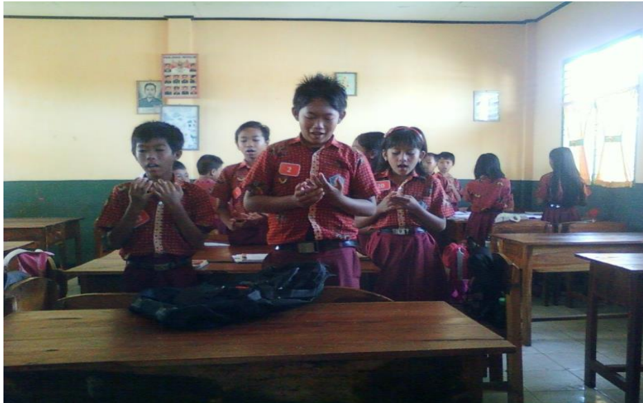
Siswa berdoa sebelum memulai pembelajaran