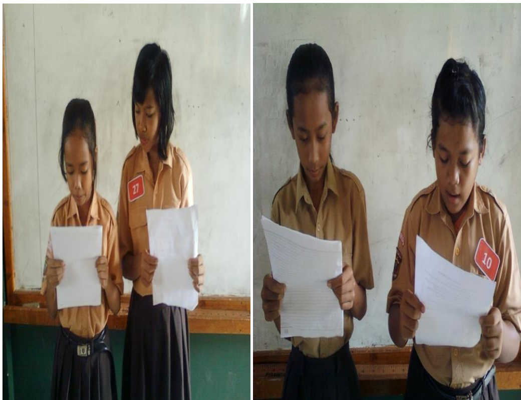
Perwakilan kelompok membacakan hasil diskusi kelompok di depan kelas