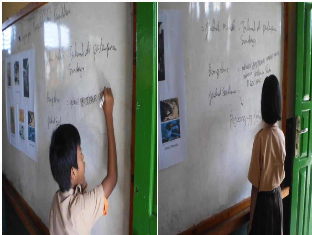
Beberapa siswa maju kedepan kelas untuk mengerjakan dan menjelaskan media berupa gambar