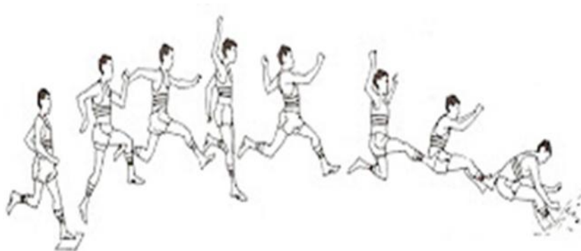
Gambar 2 : Gerakan Lompat Jauh Gaya berjalan di udara ( Walking in The Air ) secara keseluruhan

Faktor non teknis juga dapat berpengaruh dalam hal ini, faktor yang mempengaruhi tersebut antara lain :