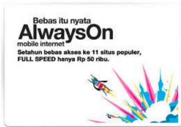
Gambar 4.3 Always On

sehingga apabila pelanggan membeli Always On 1 tahun, maka kuota apapun yang pelanggan beli selanjutnya akan mendapatkan masa pakai hingga 1 tahun. Selain bonus kuota yang dapat terakumulasi, masa pakai (validasi) Always On juga terakumulasi secara otomatis. Jika pelanggan membeli paket Always On dengan masa aktif 6 bulan, kemudian melakukan isi ulang paket Always On dengan masa aktif 6 bulan maka validasi akan bertambah 6 bulan dari akhir periode sebelumnya.