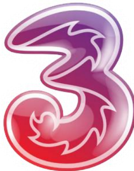
Gambar 4.6 Logo 3 (Tri)