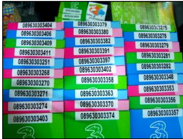
Gambar 4.5 Reguler

Paket Reguler adalah kartu telepon berjenis prabayar dengan harga Rp.50.000,- berisikan pulsa Rp.50.000,- dengan fitur M-Banking. Kartu reguler tidak memiliki fasilitas tertentu seperti yang lain.