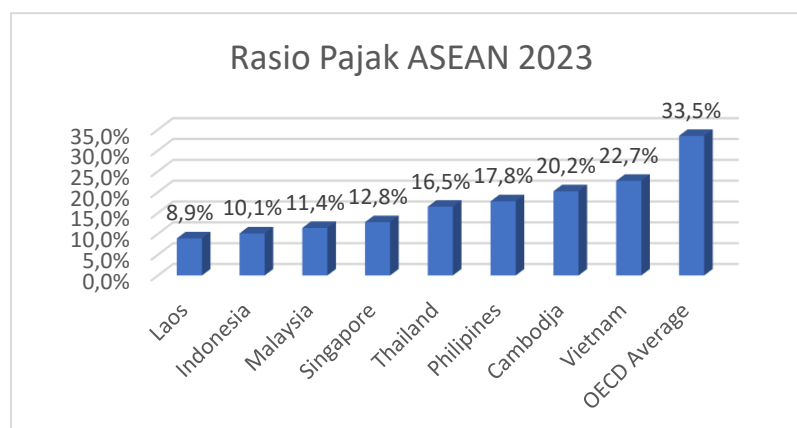
Gambar 1. 1 Rasio pajak ASEAN Tahun 2023