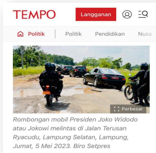
Gambar 2. Presiden Joko Widodo Mengunjungi Provinsi Lampung (5 Mei 2023)

itu dalam pernyataan sebelum kunjungan Presiden Jokowi Gubernur Lampung Arinal Djunaidi membantah perbaikan jalan rusak tidak semata-mata dilakukan hanya karena unggahan viral di media sosial ataupun rencana kedatangan Jokowi dan menyebut perbaikan baru bisa dilakukan saat ini karena proses tender baru selesai.