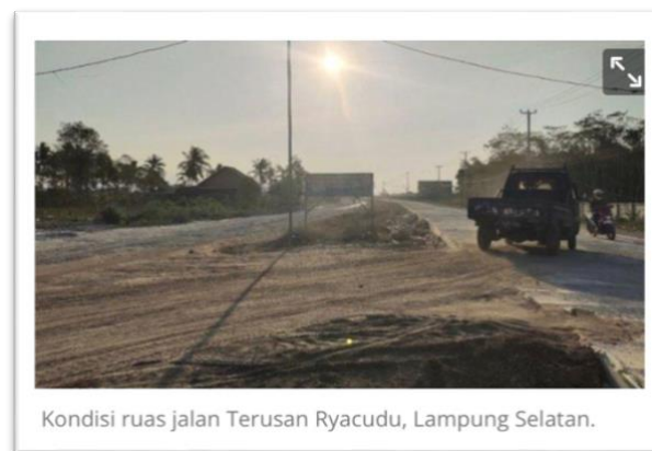
Gambar 1. kondisi jalan Ryacudu (19 Mei 2020)

Jalan Terusan Ryacudu merupakan jalan yang menghubungkan antara Jalan Tol Trans Sumatera dengan Jalan Lintas Sumatera. Seperti yang diberitakan media Radio Republik Indonesia (RRI) bahwa kondisi jalan terusan Ryacudu, di Desa Way Huwi, Kecamatan Jati Agung, Kabupaten Lampung Selatan semakin bertambah parah dan cukup memprihatinkan. Selain berlubang, jalan tersebut juga bergelombang. Kondisi ini tentu membuat masyarakat khususnya para pengguna jalan mengalami kesulitan saat akan melintas di jalan tersebut.