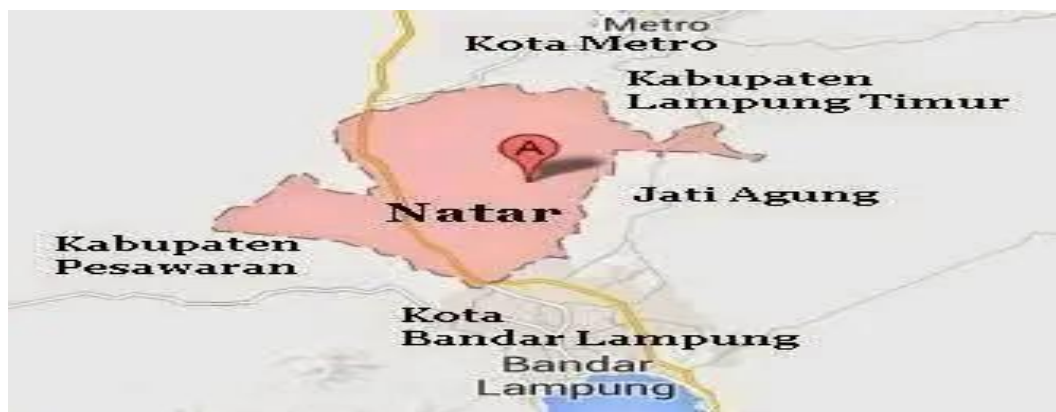
Gambar 1. Peta Wilayah Kecamatan Natar, Kabupaten Lampung Selatan.

Kecamatan Natar sebagai lokasi penelitian merupakan salah satu bagian dari wilayah Kabupaten Lampung Selatan yang membawahi 26 desa. Menurut Pusat Data Statistik, wilayah Kecamatan Natar memiliki luas 27.108 hektar dan menurut Dinas Pencatatan Penduduk dan Sipil, jumlah penduduk Natar menempati posisi terbesar dengan total penduduk 198,665 jiwa .