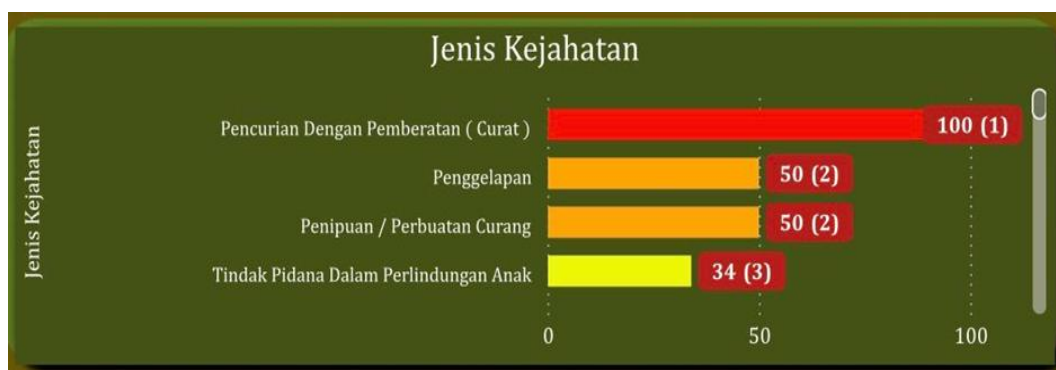
Gambar 2. Data Kejahatan Polsek Natar Pada Tahun 2023-2025 (Pusiknas Polri).

Kecamatan Natar diketahui memiliki tingkat kerawanan yang cukup tinggi terhadap terjadinya tindak kejahatan pencurian, khususnya pencurian dengan pemberatan. Kondisi tersebut tercermin dari data yang dihimpun dan dicatat oleh Polsek Natar, yang menunjukkan jumlah kasus pencurian dengan pemberatan yang terjadi dalam kurun waktu tertentu.