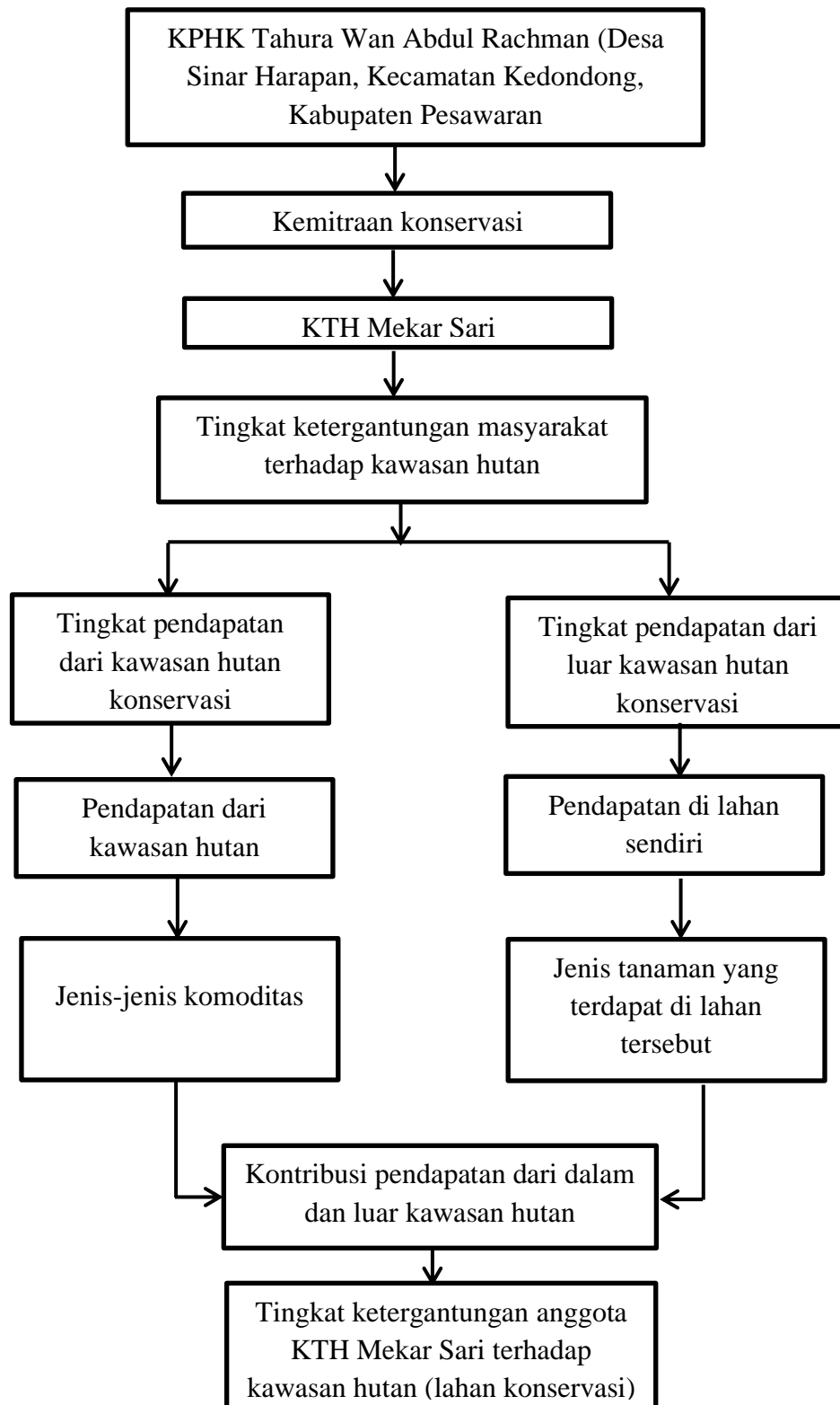
Gambar 1. Kerangka pemikiran