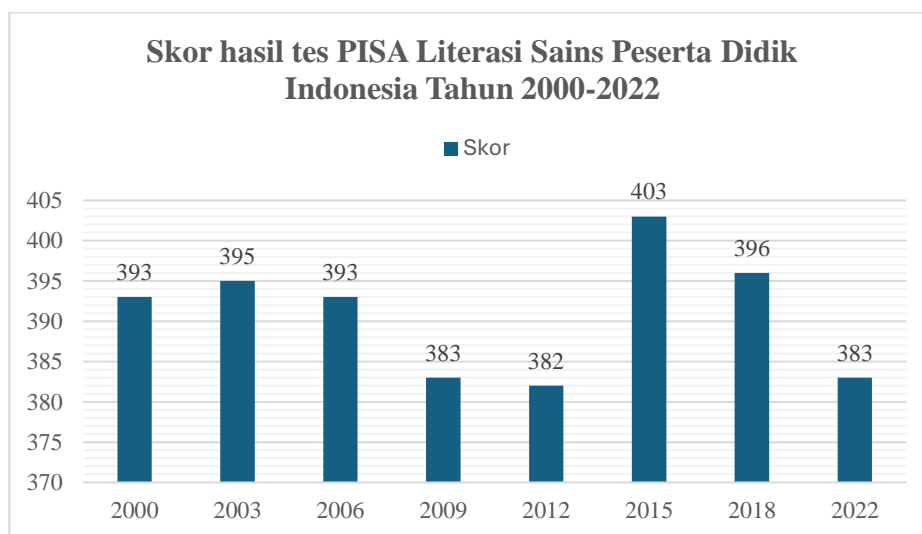
Gambar 1. Skor hasil tes PISA kemampuan literasi sains peserta didik Indonesia tahun 2000-2022. PISA, (2023)

Meskipun kemampuan literasi sains menjadi kompetensi penting, pencapaiannya di Indonesia masih menghadapi tantangan. Penurunan skor menunjukkan adanya kebutuhan untuk memperbaiki penyampaian materi sains agar lebih relevan dan menarik bagi peserta didik. Berdasarkan laporan PISA (2023) peringkat Indonesia mengalami penurunan 12-13 poin pada tahun 2022, termasuk dalam aspek kemampuan literasi sains. Adapun penurunan skor tersebut dapat dilihat dari grafik di bawah ini.