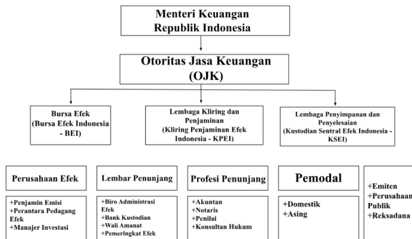
Gambar 1 Struktur Pasar Modal Indonesia.