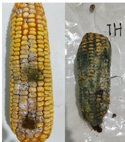
Gambar 6. Jagung yang Terinfeksi Jamur

Infeksi jamur patogen pada benih jagung dapat menyebabkan berbagai dampak negatif yang signifikan terhadap kualitas dan kuantitas hasil produksi (Gambar 5). Beberapa jamur patogen yang umum ditemukan menginfeksi biji jagung antara lain Fusarium , Aspergillus , Penicillium dan Rhizopus . Infeksi oleh jamur patogen dapat menyebabkan penurunan daya kecambah dan vigor benih. Hal ini mengakibatkan pertumbuhan tanaman yang tidak optimal dan berpotensi menurunkan hasil panen. Jamur patogen dapat mengubah bentuk dan warna benih, serta menyebabkan kerusakan pada struktur internal benih. Selain itu, infeksi jamur juga dapat mengubah komposisi kimia benih, seperti penurunan kandungan karbohidrat, protein, dan lemak (Hanif dan Susanti, 2019).