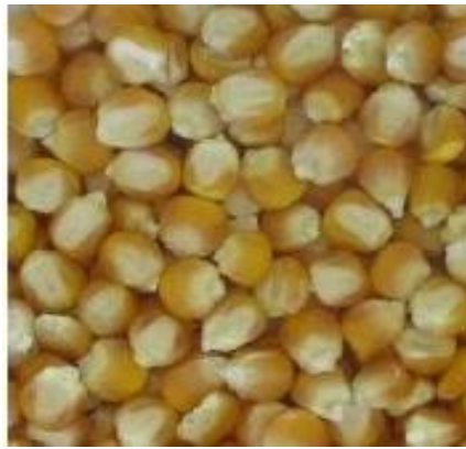
Gambar 5. Biji Jagung

Biji jagung ( Zea mays L.) memiliki karakteristik morfologi yang bervariasi tergantung pada varietasnya. Biji jagung umumnya berbentuk bulat (Gambar 5) hingga agak pipih dengan ukuran dan warna yang beragam. Warna biji jagung merupakan salah satu ciri penting yang membedakan jenis atau varietas jagung dan dapat berkisar dari kuning, putih, merah, ungu, hingga hitam. Warna biji jagung ditentukan oleh kandungan pigmen seperti antosianin dan karotenoid pada perikarp (kulit luar biji) dan endosperm (bagian dalam biji) (Ranum et al. , 2014).