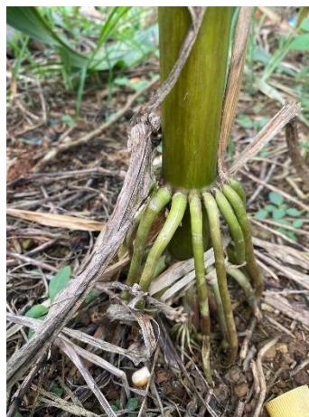
Gambar 1. Akar Jagung

Jagung ( Zea mays L.) adalah tanaman serealia yang memiliki morfologi kompleks, terdiri dari akar, batang, daun, dan bunga. Sistem perakaran jagung termasuk dalam kategori akar serabut (Gambar 1) yang terdiri dari tiga jenis, yaitu akar seminal, akar adventif, dan akar kait atau penyangga. Akar seminal berasal dari perkembangan radikula dan embrio. Akar adventif muncul dari buku pada ujung mesokotil dan selanjutnya tumbuh menjadi akar serabut yang lebih tebal. Akar kait berkembang dari dua hingga tiga buku di atas permukaan tanah, berfungsi sebagai penopang agar tanaman jagung tetap tegak, serta berperan dalam penyerapan air dan unsur hara (Sinaga, 2023).