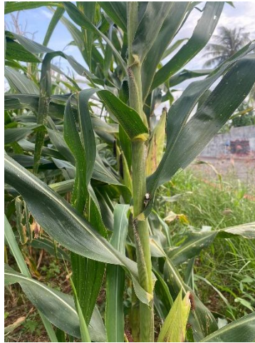
Gambar 2. Batang Jagung

Batang jagung berbentuk silindris dengan ruas-ruas yang jelas (Gambar 2), berfungsi sebagai penopang dan jalur transportasi nutrisi (Suleman dkk, 2019). Batang jagung umumnya tumbuh tegak dan bisa mencapai tinggi antara 1 sampai 3 meter tergantung pada varietas dan kondisi tumbuh. Batang jagung simpul ( node ) berfungsi sebagai penghubung antara daun dan buah. Batang jagung juga memiliki kemampuan untuk mengeluarkan lendir dari bagian epidermis, yang dapat membantu dalam proses pertahanan terhadap serangan hama dan patogen (Latifa dan Indriyatmoko, 2023).