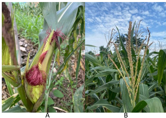
Gambar 4. Bunga Betina (A), Jantan (B) dalam Satu Pohon

Bunga pada tanaman jagung terbagi menjadi dua jenis, yaitu bunga jantan dan bunga betina (Gambar 4), yang masing-masing terpisah dalam satu tanaman serta memiliki aroma yang khas (Djafar dkk., 2021). Bunga jagung bersifat monoecious , dengan bunga jantan terletak di pucuk tanaman dan bunga betina berada di tengah batang. Bunga jantan menghasilkan serbuk sari yang akan menyerbuki bunga betina melalui bantuan angin dan menghasilkan biji yang tersusun pada tongkol (Cahyadi, 2022).