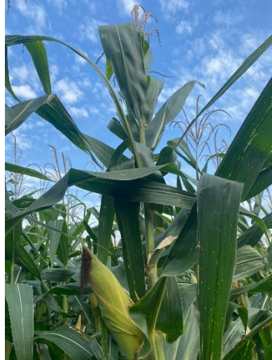
Gambar 3. Daun Jagung

Bunga pada tanaman jagung terbagi menjadi dua jenis, yaitu bunga jantan dan bunga betina (Gambar 4), yang masing-masing terpisah dalam satu tanaman serta memiliki aroma yang khas (Djafar dkk., 2021). Bunga jagung bersifat monoecious , dengan bunga jantan terletak di pucuk tanaman dan bunga betina berada di tengah batang. Bunga jantan menghasilkan serbuk sari yang akan menyerbuki bunga betina melalui bantuan angin dan menghasilkan biji yang tersusun pada tongkol (Cahyadi, 2022).