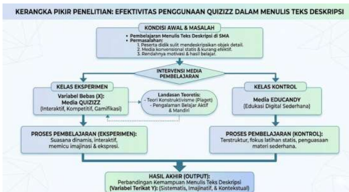
Gambar 2.1 Bagan Kerangka Pikir Penelitian

Berdasarkan uraian di atas, maka alur pemikiran dalam penelitian ini dapat digambarkan dalam bagan kerangka pikir sebagai berikut: