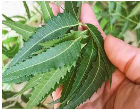
Gambar 2. Daun mimba

Kingdom : Plantae Subkingdom : Tracheobionta Division : Magnoliophyta Class : Eudicot Subclass : Rosidae Order : Sapindales Family : Meliaceae Genus : Azadirachta Species : A. Indica