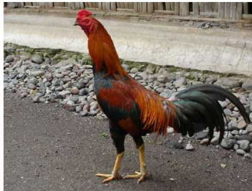
Gambar 1. Ayam KUB

Keunggulan ayam kampung yaitu mempunyai produksi daging dengan rasa dan tekstur yang khas dan tahan terhadap beberapa jenis penyakit. Salah satu kelemahan dari ayam kampung adalah tingkat produktivitas dan pertumbuhannya yang cukup lama. Bila dibandingkan dengan ayam ras, maka ayam kampung mempunyai ukuran tubuh yang lebih kecil, ini menunjukkan kemampuan produksi daging yang lebih rendah pula (Rajab dan Papilaya, 2012). Gambar fisik ayam KUB yang menjadi objek dalam penelitian ini disajikan pada Gambar 1.