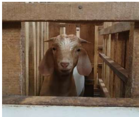
Gambar 1. Kambing cross boer jantan

Kambing cross boer merupakan kambing dari perkawinan silang antara kambing Boer dengan kambing lokal (Nugroho et al. , 2019). Persilangan antara kambing boer dan kambing lokal juga memungkinkan kambing untuk beradaptasi secara efektif dengan iklim dan cuaca di Indonesia karena kambing boer aslinya hidup di iklim semi-arid.