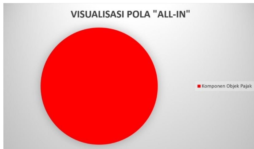
Gambar 1. 1 Perbandingan Visualisasi Pola “ All-In ”

Dalam praktik bisnis modern, banyak transaksi bersifat kompleks, salah satunya adalah munculnya model layanan terintegrasi atau “ bundling services ”, seperti pola “ All-In .” Dalam pola “ All-In ,” yang menjadi studi kasus di PT MPX Indonesia, biaya layanan mungkin sudah mencakup biaya operasional. Ketidakjelasan dalam memisahkan komponen biaya ini dapat memicu problematika yuridis dan administratif yang signifikan. Titik kritis dari masalah ini terletak pada penentuan Dasar Pengenaan Pajak (DPP). Dalam pola ini, jumlah yang dibayarkan oleh customer adalah angka tetap yang mencakup semuanya: uang jalan driver , komisi driver , biaya bahan bakar, biaya penyeberangan, biaya muat-bongkar (TKBM), serta margin keuntungan 10% (exclude tax). Dari perspektif bisnis, pola “ All-In ” sangat efisien karena menyederhanakan administrasi penagihan dan memberikan kepastian biaya bagi perusahaan. Namun, dari perspektif perpajakan, transparansi nilai menjadi hilang.