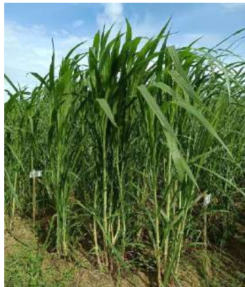
Gambar 1. Rumput pakchong

Rumput pakchong ( Pennisetum purpureum cv. Thailand) adalah hasil dari persilangan antara rumput gajah ( Pennisetum purpureum Schumach) dengan Pearl Millet ( Pennisetum glaucum ). Proses pengembangan dan penelitian berlangsung selama enam tahun yang dipimpin oleh Dr. Krailas Kiyothong, seorang ahli dalam bidang nutrisi dan pemuliaan (Suherman, 2021). Beberapa keunggulan rumput pakchong meliputi pertumbuhannya yang bisa mencapai lebih dari tiga meter dalam waktu kurang dari 60 hari dengan kandungan protein kasar mencapai 16—18% (Harianti et al. , 2023). Menurut Ahmed et al. (2021), rumput pakchong dengan interval pemotongan 60 hari mampu meningkatkan berat kering total mencapai 0,68 kg per tanaman. Bentuk morfologi rumput pakchong dapat dilihat pada Gambar 1.